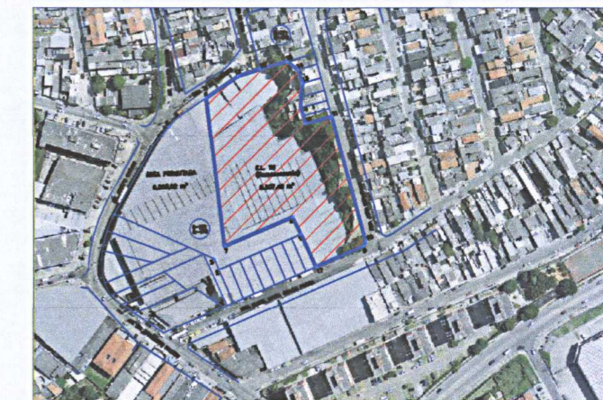
SITUAÇÃO SEM ESCALA