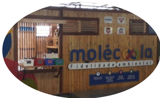
SHOPPING JARDIM SUL