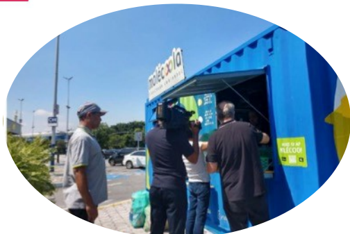
SHOPPING CENTER NORTE