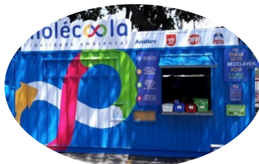
MAKRO VILA MARIA