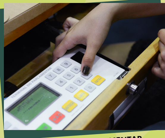
TERMINAL DO PARLAMENTAR PARA REGISTRO DOS VOTOS