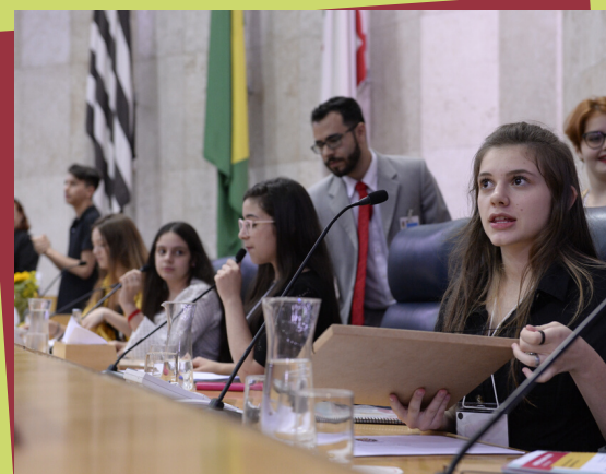
MESA DIRETORA DO PARLAMENTO JOVEM 2019