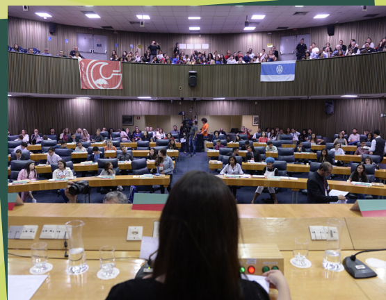
A SESSÃO É REALIZADA NO PLENÁRIO 1º DE MAIO

Em seguida, os vereadores jovens irão à tribuna apresentar e defender seus projetos de lei, que serão submetidos à votação dos colegas.