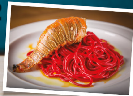
Imagem vencedora na categoria "Foto" em 2021.

Podem concorrer reportagens, programas, revistas, guias, fotos, aplicativos, páginas em redes sociais e trabalhos acadêmicos (TCCs) cujo tema seja a gastronomia paulistana.