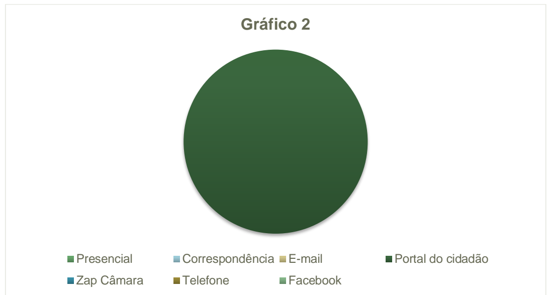
Gráfico 2 – Canais de Atendimento da LAI

Nos canais de atendimento da Ouvidoria para manifestações LAI, constata-se preferência pelo Portal do cidadão.