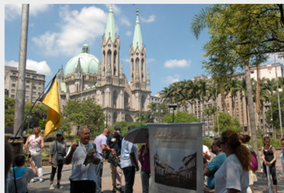
Marcos históricos do Parlamento (25/01/2011)

O fortalecimento do Poder local passa obrigatoriamente pelo resgate da história da Cidade e empoderamento do cidadão