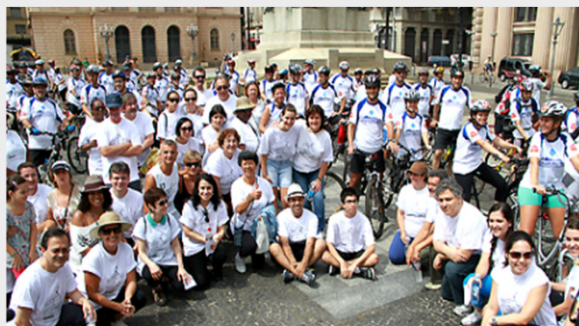
Marcos da Educação (27/02/2011)