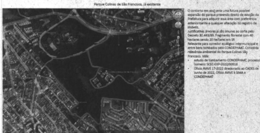
Imagem 01: Vista por satélite Google Earth do Bairro Vila São Francisco, Parque Colinas e Região

Requeremos que seja incluído no Quadro 7 e Mapa 5 do Plano Diretor mais um parque na Subprefeitura do Butantã, distrito do Rio Pequeno, ou ainda que o Parque Colinas seja ampliado, em ambos os casos para que o parque absorva esta área indicada em azul e em verde (VIDE IMAGEM 01), eis que é área de Remanescentes do Bioma da Mata Atlântica, já identificadas pelo PMMA – Plano Municipal da Mata Atlântica, no GEOSAMPA (VIDE IMAGEM 02) e precisamos seguir com específicas inclusões protetivas dessas áreas no Plano Diretor em Revisão.