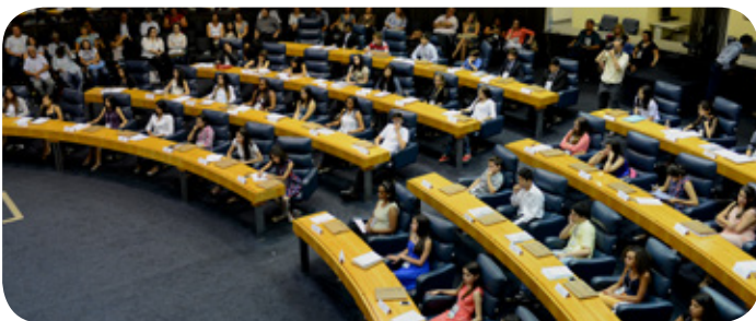
A sessão é realizada no Plenário Primeiro de Maio

Já no dia 13 de novembro, as atividades se estenderão durante todo o dia, das 9 às 17 horas, com um intervalo para almoço. O presidente da Câmara Municipal de São Paulo fará a abertura oficial da sessão, diplomará e dará posse aos vereadores jovens eleitos. Após a posse, ocorrerá a eleição da Mesa Diretora do Parlamento Jovem Paulistano 2015, que será responsável pela coordenação dos trabalhos do dia. Em seguida, os vereadores jovens irão à tribuna apresentar e defender seus projetos de lei, que serão submetidos à votação dos colegas.