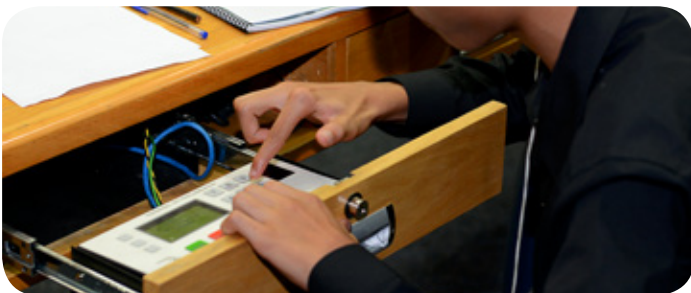
Vereador jovem registra seu voto no painel eletrônico